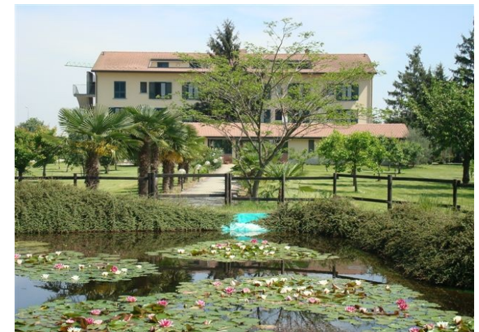
Il laghetto in estate con le ninfee