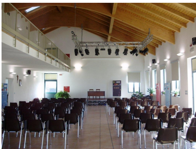
La sala congressi

Per l'uso dei locali, inviare richiesta alla Direzione di Casa Carla Maria.