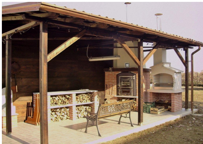
L'angolo con forno e griglia