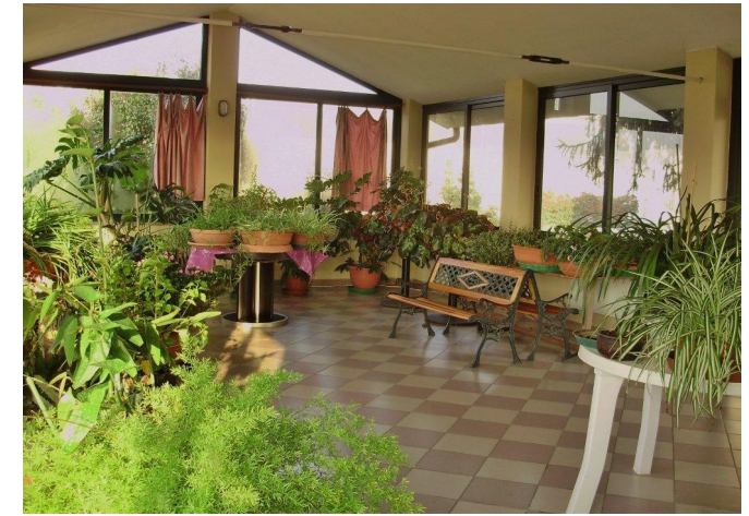
La serra fioriera