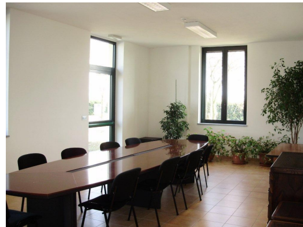
La sala riunioni