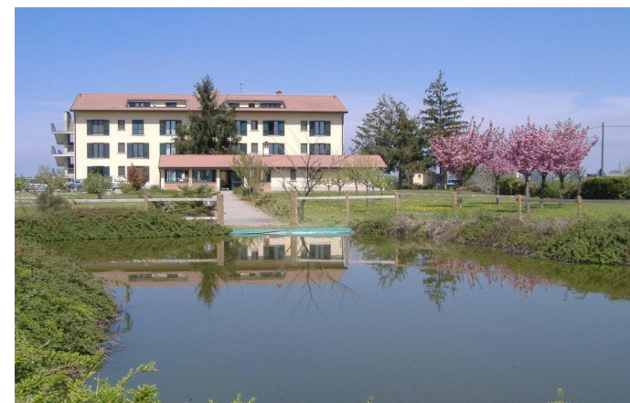
La casa, il giardino, il laghetto