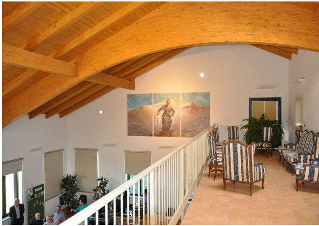
Il Salone dal soppalco.