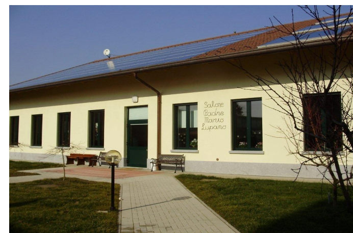
Il salone multifunzionale