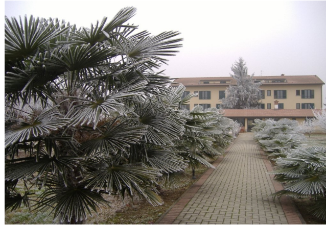
Il viale nel parco